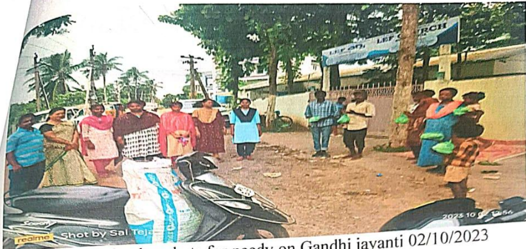
❖ Donate 25 food packets for needy on Gandhi jayanti 02/10/2023