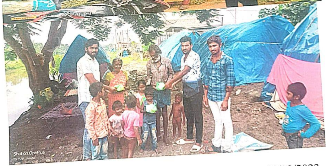
❖ Donate 25 food packets for needy on Gandhi jayanti 02/10/2023